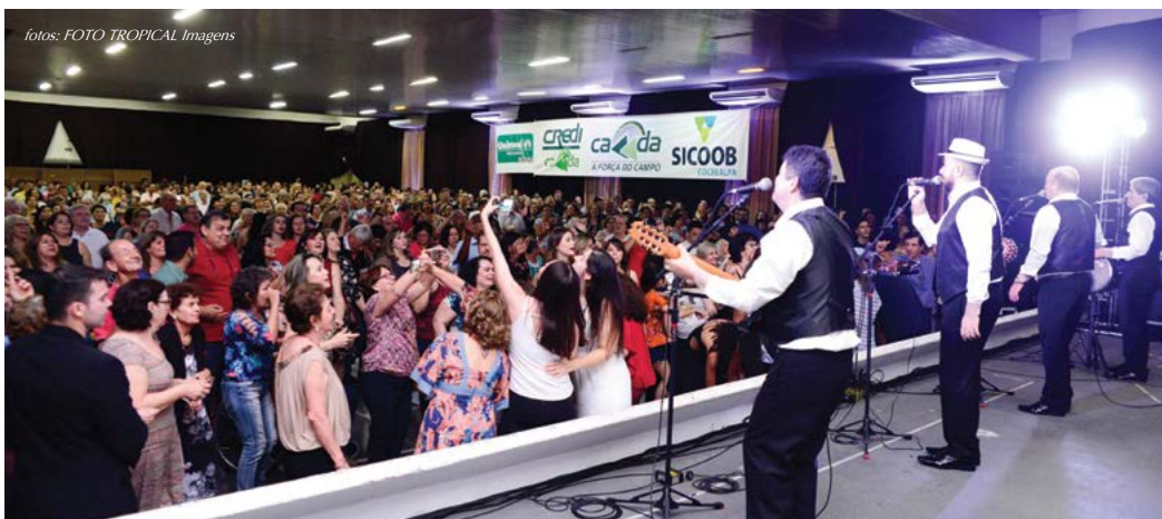
Nesta apresentação única houve um público de cerca de 1.300 pessoas