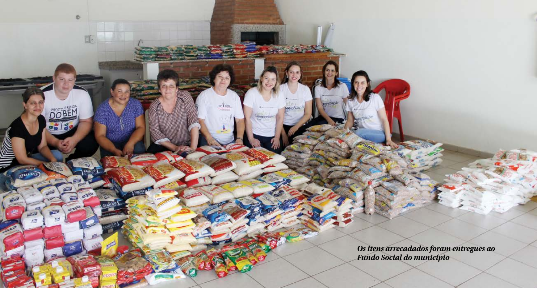
Os itens arrecadados foram entregues ao Fundo Social do município